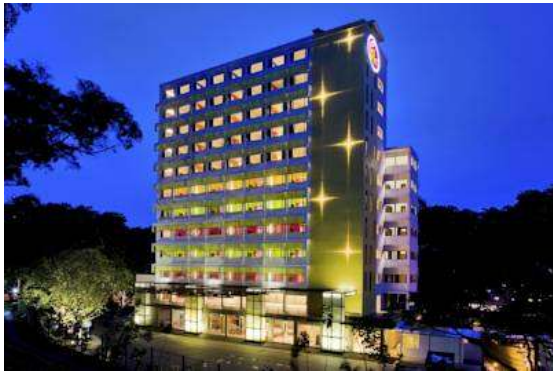
Moon hotel free wifi or Hotel RE ***3+