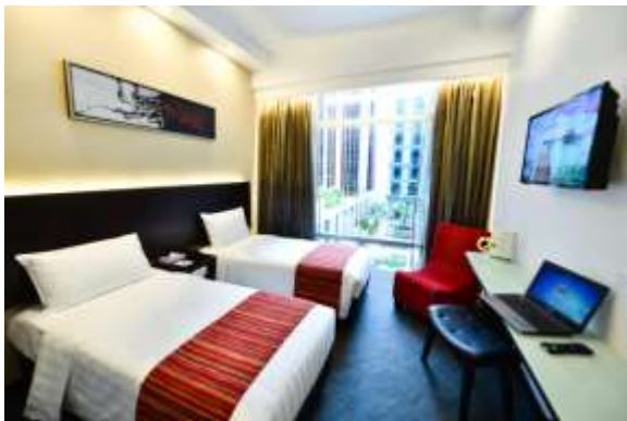
Grand Chancellor orchard**** 3.5