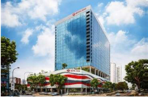
Boss hotel lavender free wifi ****3.5